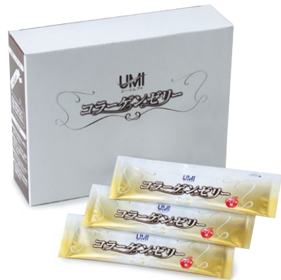
1箱30本入(約1ヶ月分、1日1本目安)