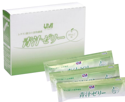
1箱30本入(約1ヶ月分、1日1本目安)