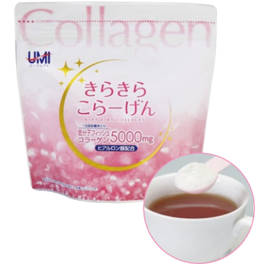
1袋201g入(約1ヶ月分、1日6.7g目安)