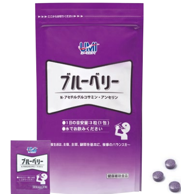
1袋30包入(1包3粒)(約1ヶ月分、1日3粒目安)