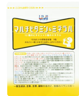
1袋150粒入(約1ヶ月分、1日5粒目安)