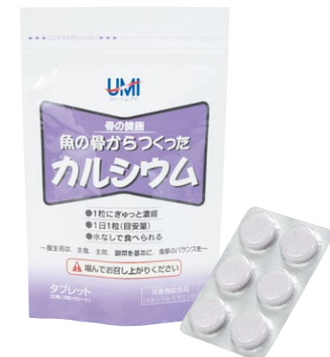
1袋30粒入(約1ヶ月分、1日1粒目安)